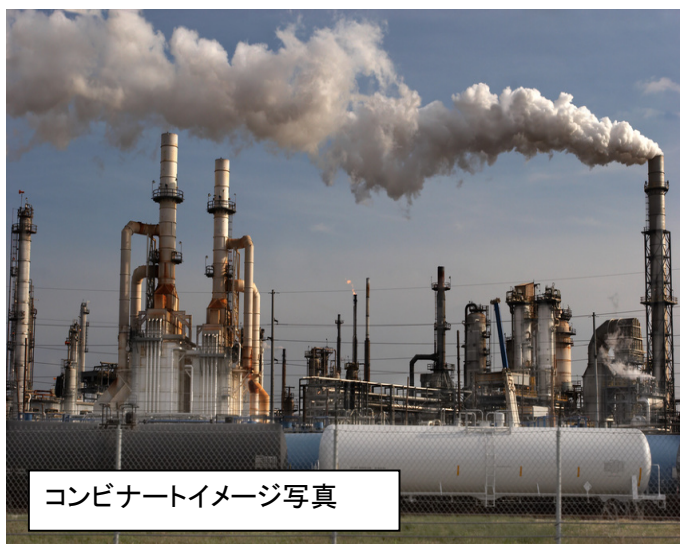
コンビナートイメージ写真

コンビナートに設置されているFRPタンクの表面劣化が顕在化し、ささくれてガラスマットが毛羽立ってきたため、セラポリマーFX クリアー (旧名: パイロキープFXクリアー) が上塗り塗布された。