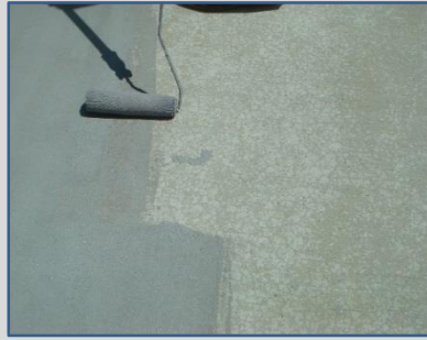
S クリートフローアー塗布