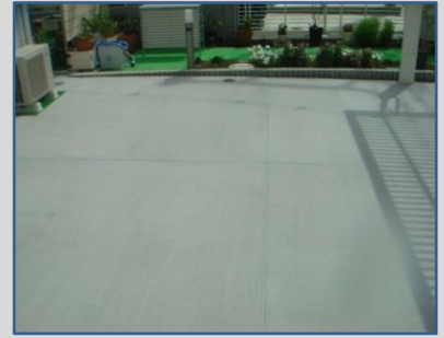
きれいに仕上がり