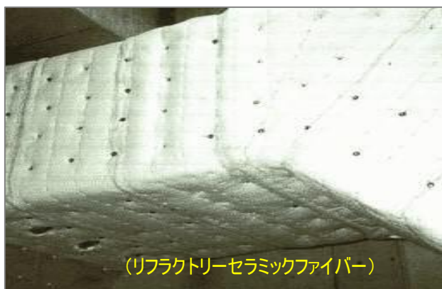
(リファクトリーセラミックファイバー)

断熱セラミックファイバーの一種で、アルミナとシリカを混合したもので、材料繊維が細かく健康障害の可能性がある。建築の梁、柱等の耐火被覆、煙導などのパッキン、空調ダクトの耐火被覆、炉の断熱等幅広く採用されている。