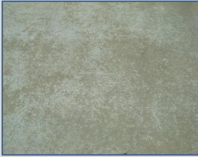
まだらになった床面